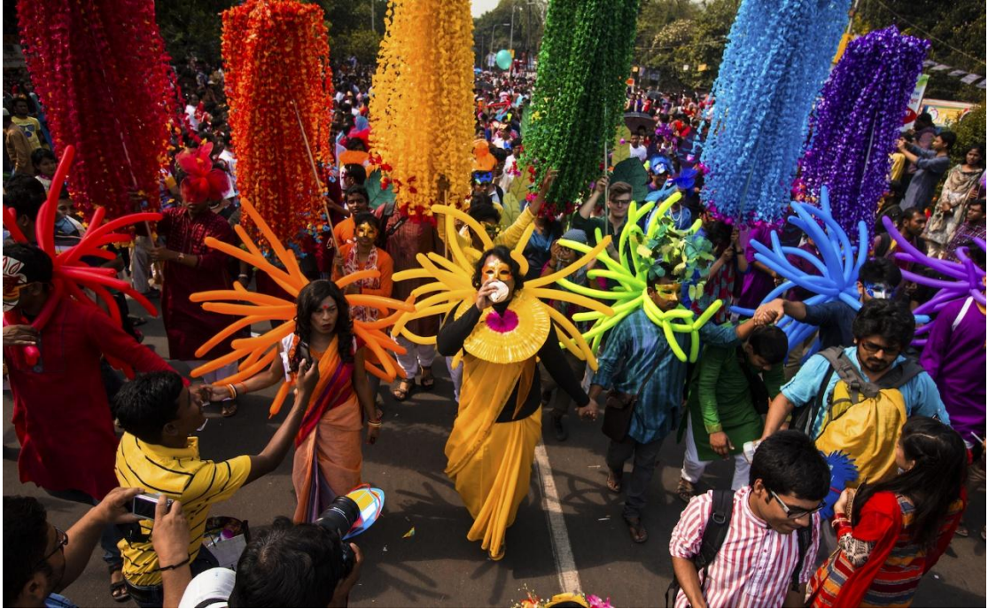
রঙধনু র্যালি, ঢাকা, বাংলাদেশ